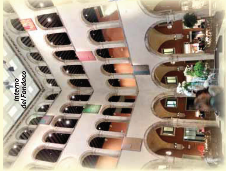
Interno del Fondaco