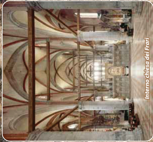
Interno chiesa dei Frari