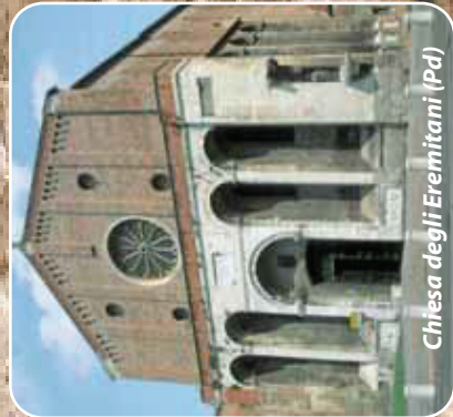
Chiesa degli Eremitani (Pa)

Ogni mercoledì dalle ore 15 alle 18 sulla frequenza Radio 94 mhz Interviste a personaggi del mondo culturale, critici d'arte, presentazioni di libri e mostre, ecc.