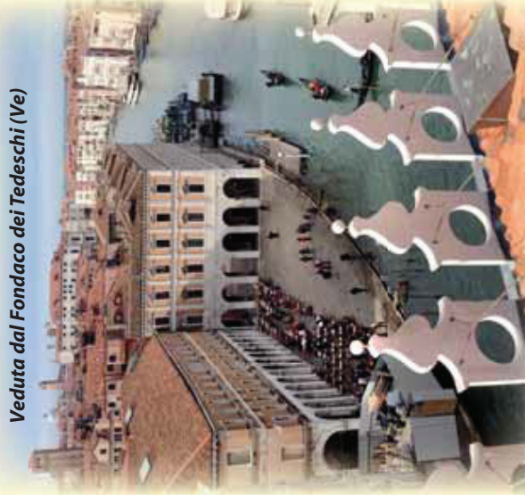
Veduta dal Fondaco dei Tedeschi (Ve)

Relatrice prof.ssa Antonia Arslan, docente e autrice di numerosi saggi, nota soprattutto per il romanzo "La masseria delle allodole."