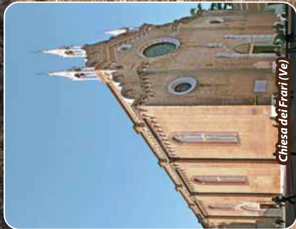
Chiesa dei Frari (Ve)