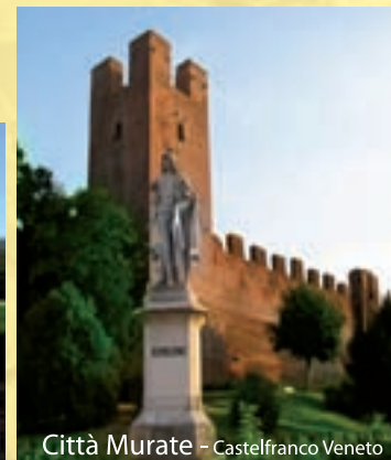
Città Murate - Castelfranco Veneto