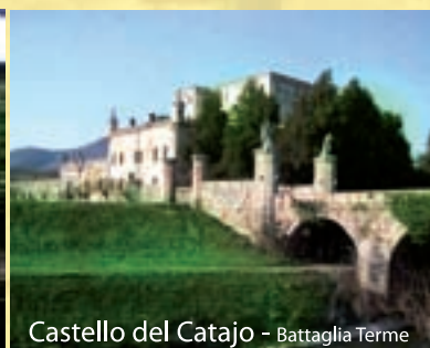
Castello del Catajo - Battaglia Terme