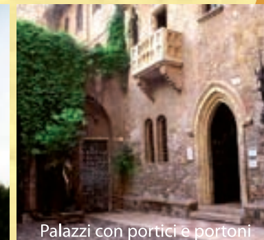
Palazzi con portici e portoni

Comitato Spontaneo per la Salvaguardia del Territorio di Vigodarzere