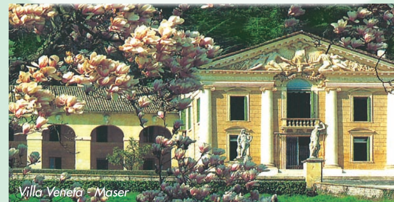
Villa Venera - Maser

Per Info: Tel. 333-4530456 e-mail: info@marisastoria.it