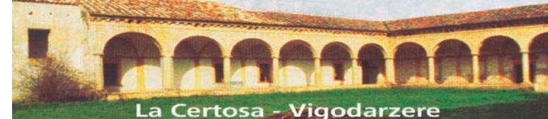
La Certosa - Vigodarzere

Il Comitato Spontaneo per la Salvaguardia del Territorio di Vigodarzere